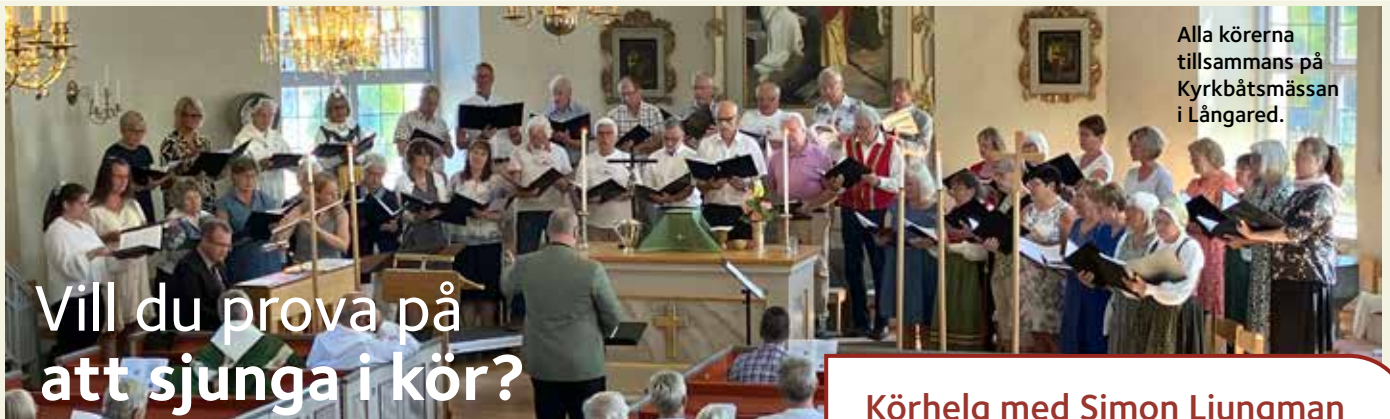
Alla körerna tillsammans på Kyrkbåtsmässan i Långared.