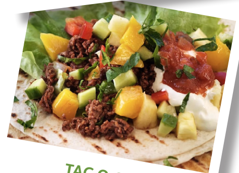
TAC O GUD 3 nov Fuxerna församlingshem