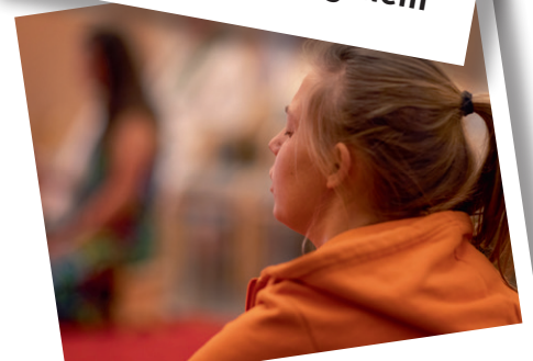
RETREATDAG 25 nov Västerlanda kyrka