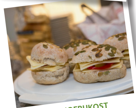
KVINNOFRUKOST 14 okt Hjärtums församlingshem