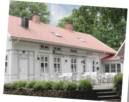
UTFLYKT 1 okt Karlsrogården

Vi vandrar utmed älven norrut, går över gamla bron och slussen upp till Strömsskolan, genom slottsparken, över nya bron, utmed älven söderut till Fuxerna kyrka där vi avslutar med andakt. Vandringen är cirka 6 km.