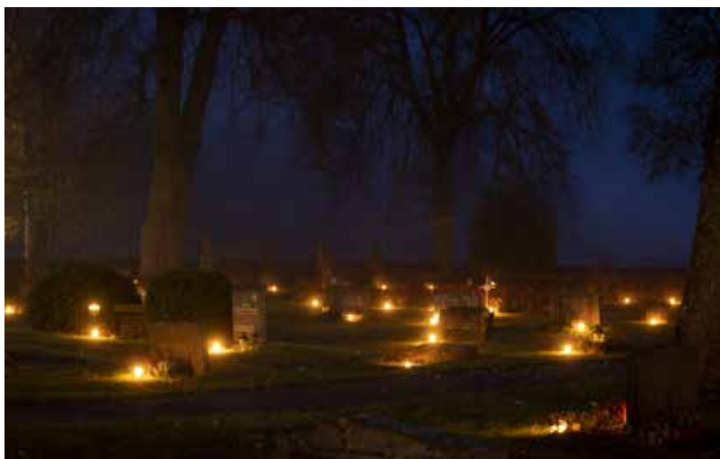
GUSTAF HEJLSING / KON