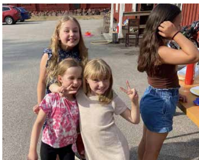
Sommarkollo blandade friskt inomhus och utomhus under innehållsrika dagar i sommar.