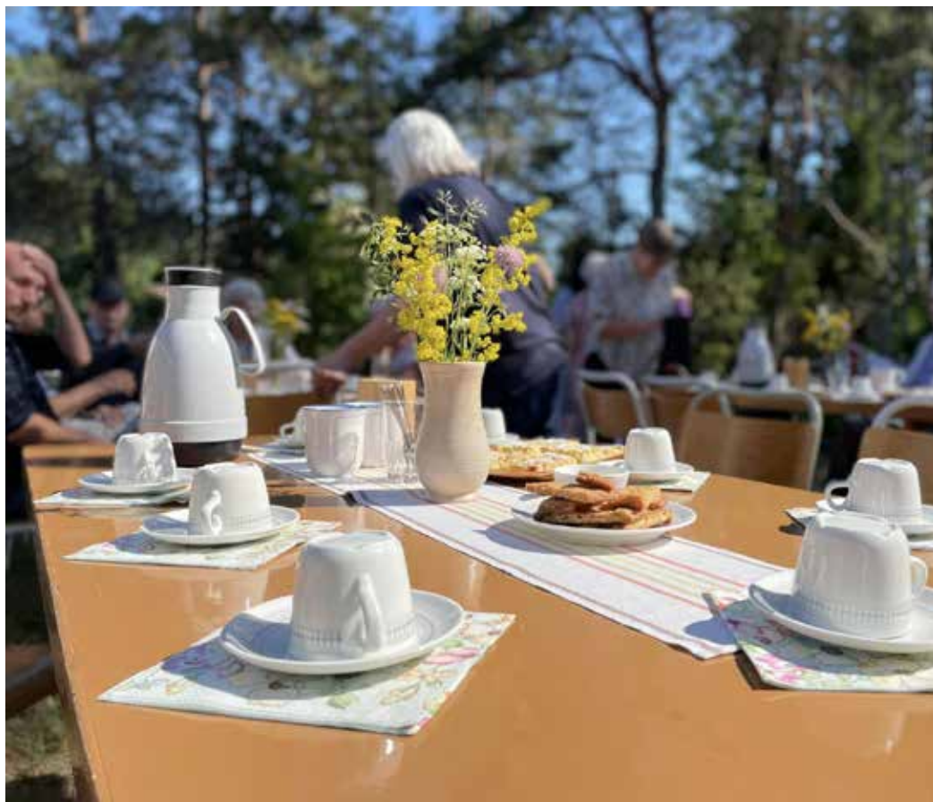
Café på kyrkbacken lyckades nästan hela sommaren vinna arbrytningen med vädret..