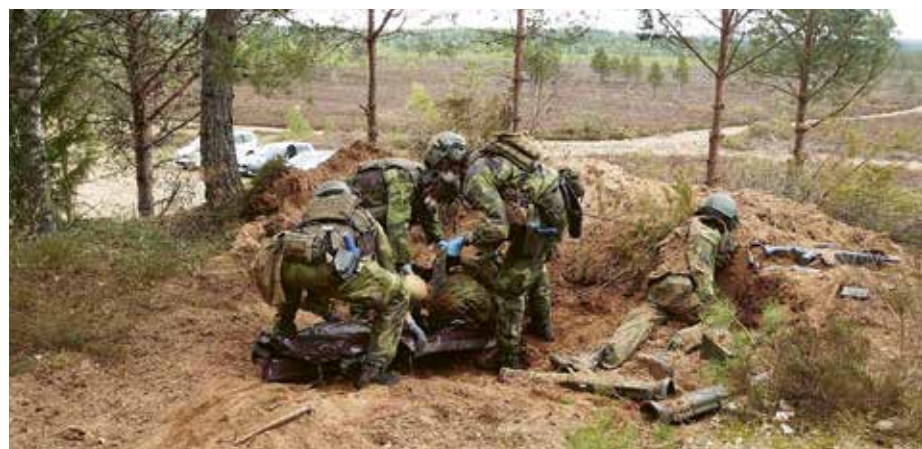
Övning i att ta hand om döda i ett område med oexploderad ammunition och granater.

Är det rätt att döda? I femte budet står det – Du skall icke dräpa, det kan vara inledningen på ett samtal med en soldat. Eller med en officer kan det vara: jag känner mig otillräcklig mot min familj eftersom jag är borta så mycket på utbildningar och övningar. Det kan också vara att det är jobbigt idag: den ukrainske soldat jag utbildade och lärde känna för några månader sedan stupade igår.