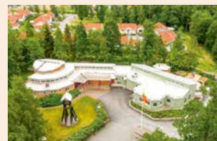
Mariakapellet i Eksjö är byggt 1994. Mariagårdens förskola (gröna delen) stod klar 2018.