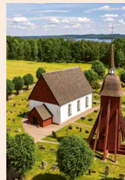
Mellby kyrka är en medeltida stenkyrka med timrade spånklädda gavlar. Takstolarna är uppförda av timmer som fällt på 1290-talet och 1340-talet. Den fristående klockstapeln är byggd 1673.