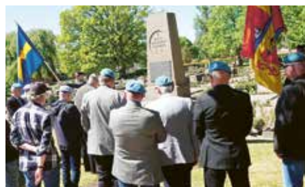
Ceremoni med korum på Sankt Lars kyrkogård i samband med firandet av Veterandagen den 29 maj 2022.

Militärpastorn deltar också i utbildningen av soldater. Bland annat genom att träffa