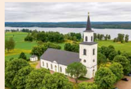
Flisby kyrka uppfördes 1850-53 som en typisk nyklassisk salkyrka.