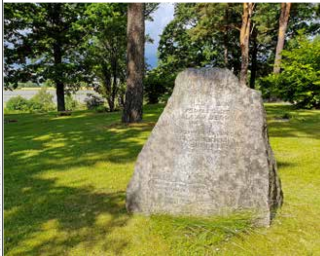
Hjalmar Bergmans grav finns på Norra kyrkogården.

➤ LÄS MER om kyrkogårdarnas konst och kulturhistoria, samt se filmer om några speciella gravar på svenskakyrkan.se/orebro/kulturhistoria