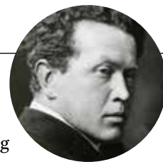
Hjalmar Bergman, 1883–1931.