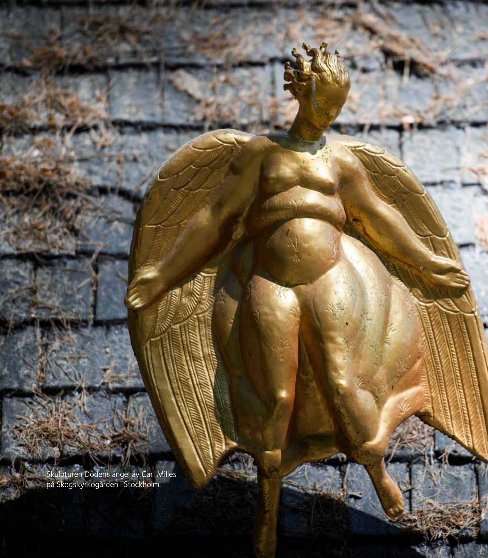
Skulpturen Dödens ängel av Carl Milles på Skogskyrkogården i Stockholm.