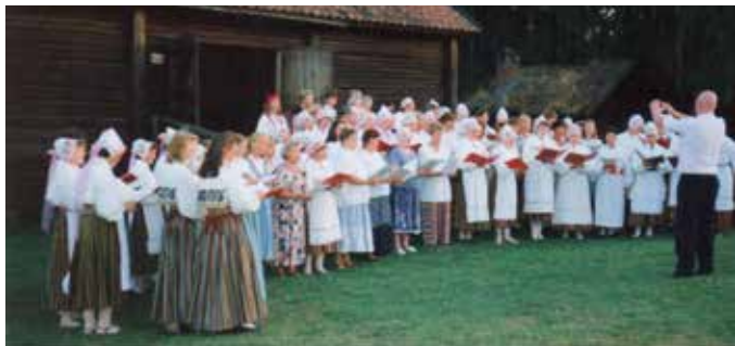
Eda hembygdsgård 1994

Sammanhållningen har stärkts genom att körmedlemmarna, utan att det minsta ge avkall på den verksamhet som de är satta att svara för i pastoratet, satsat både tid och ekonomi på att skapa trivsel genom resor och gemensamma måltider. Vi har också försökt att vara en aktiv del av bygdens kulturliv genom musikkaféer och liknande. Alla körsångare som funnits i kören under dessa mina 57 år i kören vore värda ett omnämmande. Alla hymner vi sjungit i kören vore också värda att berätta om. Alla gudstjänster och kyrkokonserter i Eda församling vi medverkat i vore värda att beskriva. Problemet är bara att de är så många. Därför får ni, kära läsare, förstå, om jag till sist väljer några ögonblick i körens historia som blivit alldeles speciella minnen för mig.