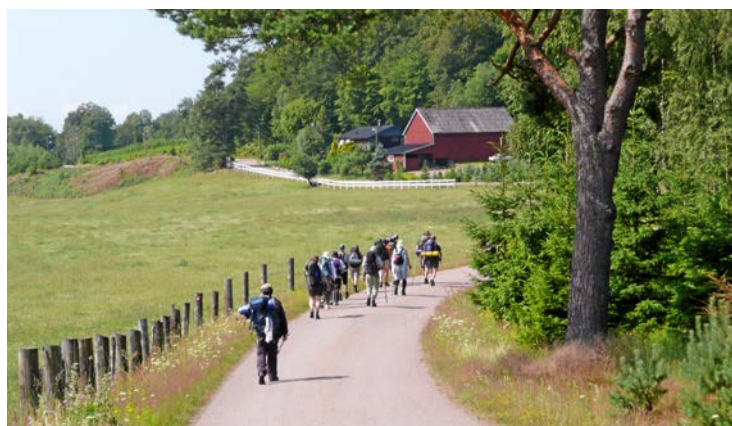
Längs kultur- och pilgrimsvandringen till Härlig är jorden, får deltagarna uppleva pastoratets rika kultur och natur.