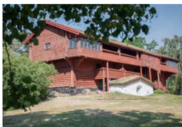
Vandringen går förbi Ornässtugan.

Under vandringen besöker deltagarna ett nunnekloster, en bergsmansgård med stor barockträdgård, Ornässtugan där Gus-