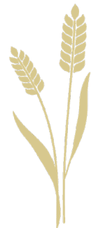
Illustration: Karin Dahlström