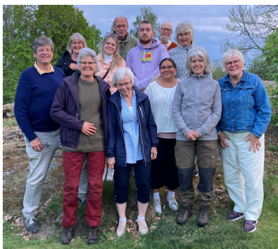
Bild till höger: Vist och Vårdnäs församlingsråds för dagen närvarande representanter.