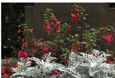
Rosa fuchsia med kantväxt