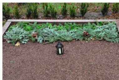
Slättäckning av planteringsyta