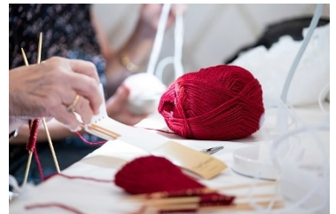
Ikon