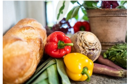
Ikon

Middagsbön kl.11.30 i Söderbärke kyrka innan sopplunchen,