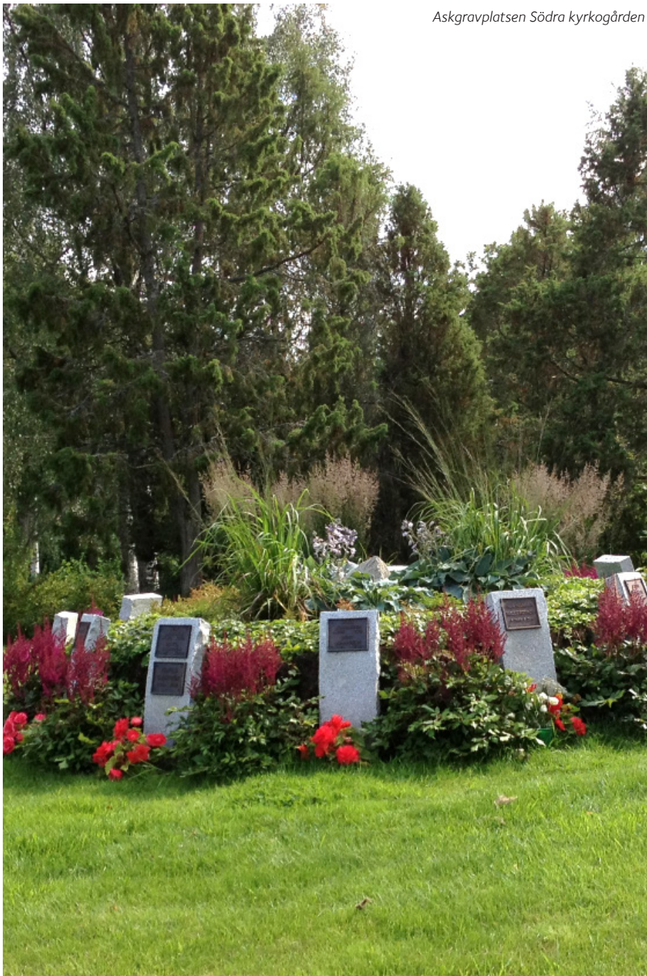
Askgravplatsen Södra kyrkogården