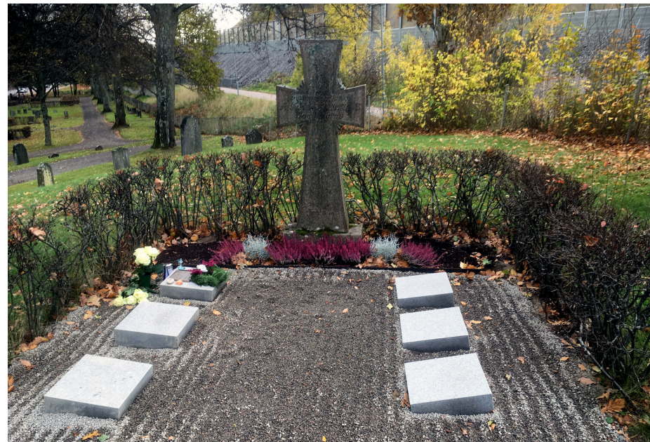
Askgravplatsen Gamla kyrkogården

Askgravplats är ett alternativ för den som vill ha en grav märkt med namn och där gravskötsel ingår i 25 år.