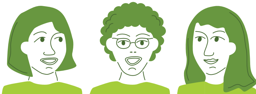
Illustration: Julia Åström

» Undervisningen i ämnet religionskunskap ska syfta till att eleverna utvecklar kunskaper om religion och livsåskådning i det svenska samhället och i olika delar av världen. Genom undervisningen ska eleverna få förståelse för hur människor inom olika religiösa traditioner lever med och uttrycker sin religion på olika sätt. Eleverna ska också ges möjlighet att reflektera över vad religion och livsåskådning kan betyda för människors identitet och hur egna utgångspunkter påverkar förståelsen av religion och livsåskådning. « Ur Lgr22 Syfte