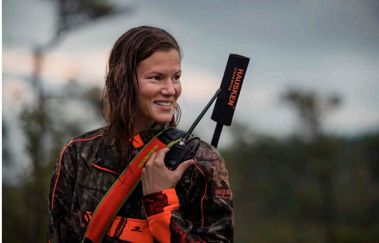
Det fungerar bra att bo i Österbybruk och pendla till jobbet på Sveriges Olympiska Kommitté i centrala Stockholm två dagar i veckan.

oss inom jägarkåren. Att hålla djurstammen på en lagom nivå. För många djur av vissa arter är inte bra, det blir sjukdomar, trafikolyckor och skador på jord- och skogsbruk. Det behöver vara på en lagom nivå för att kretsloppet ska fungera.