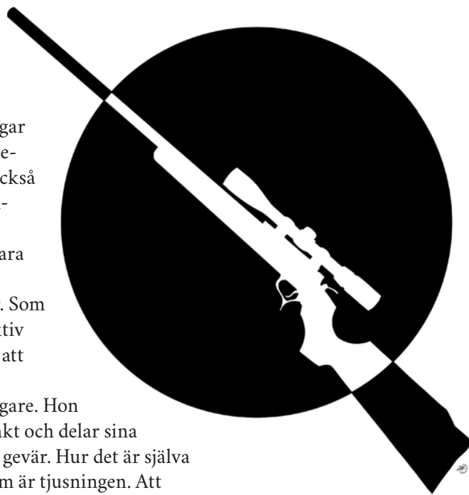
ILLUSTRATION: THEA ANDERSSON

Tidningen ges ut av Svenska kyrkan, Roslagens norra pastorat