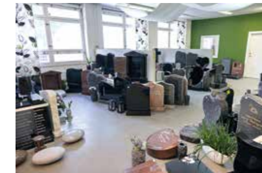
Översikt över verkstaden.

lokalen. Att röra sig här påminner lite om dans-koreografi.