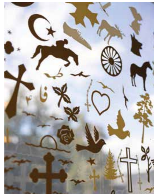
Schabloner som används vid formgivning av gravstensristningar.