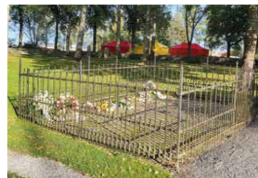
Blommor utlagda på Järfälla kyrkogård efter en begravning.