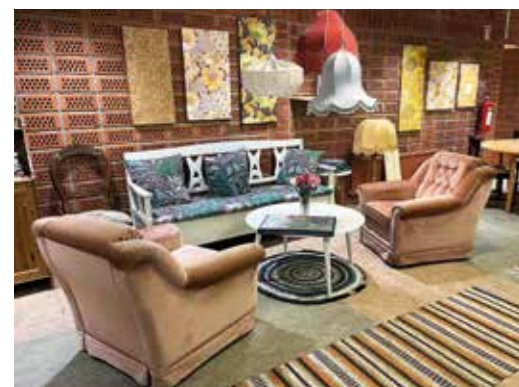
Kökssoffa med fåtöljer. Gruppen sammanställd av möbler med lite äldre design.