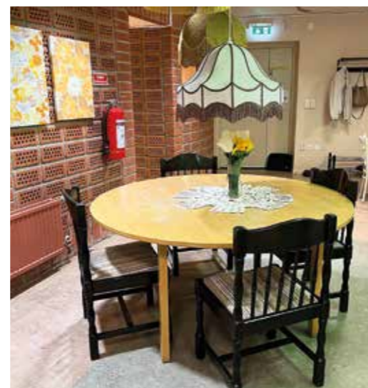
Matsalsgrupp, sammansatt av 1950- och 70-talsmöbler. På väggen tavlor som Maria Lundqvist gjort av tapetbitar.