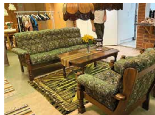
Gillestugebonanza. Tidstypisk soffgrupp från 1970-talet.