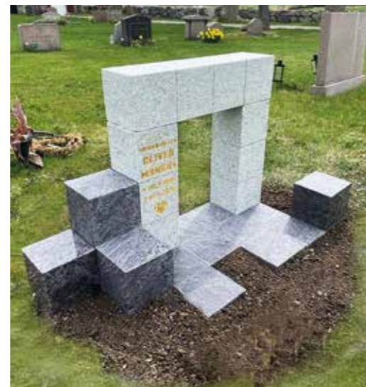
Gravsten utformad med inspiration från data-spelet Minecraft.