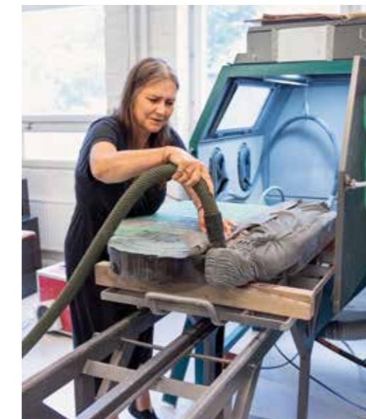
Lotten dammsuger vid blästringsmaskinen.