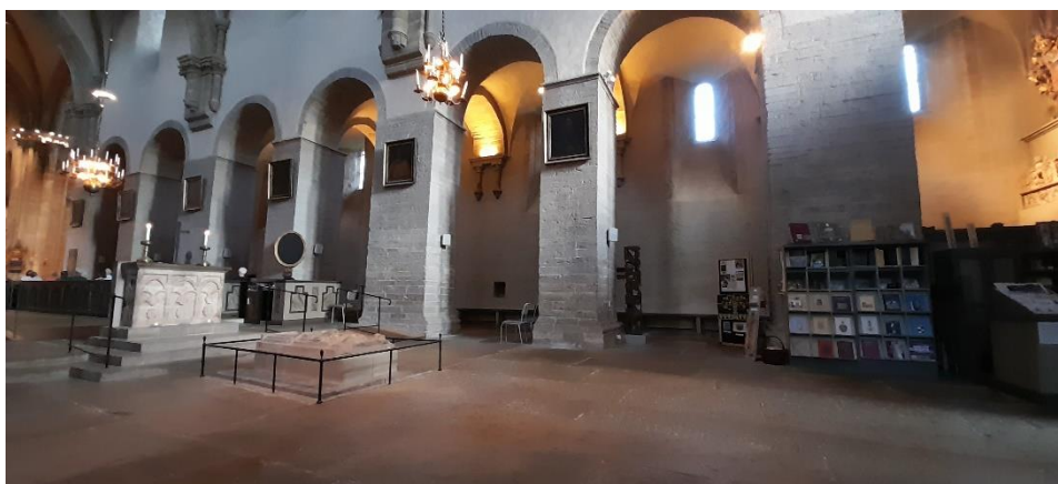
Varnhems klosterkyrka.

Genom ett välkomnande, öppet och inbjudande förhållningssätt, vilket hela tiden måste erövrats och innehållsbestämmas, skapar församlingarna nyfikenhet inför den kristna tron, med erbjudande om undervisning, fördjupning och gudstjänst. Bokbordet i kyrkorna tillsammans med guideverksamheten i Skara domkyrka och Varnhems klosterkyrka är exempel på sådan inbjudan. Församlingens riktning är både inåt och utåt i växelverkan.