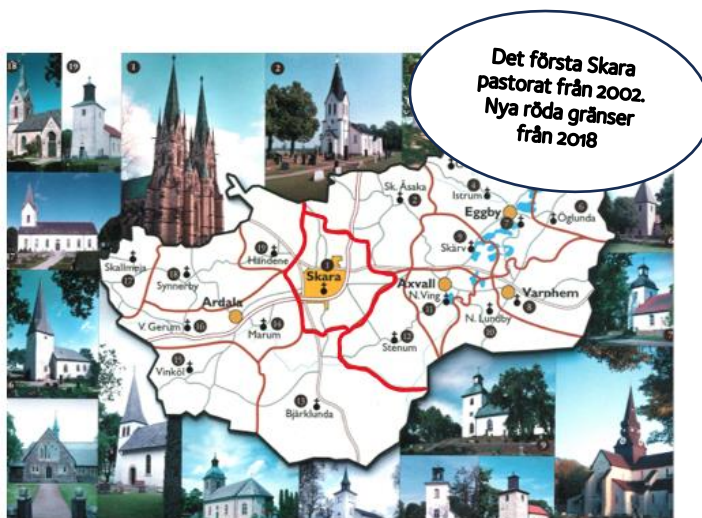
Vykort Skara pastorat

Skara pastorat i Skara stift är en del av Svenska kyrkan och manifesteras lokalt tillsammans med troende och döpta i andra kyrkor i Kristi världsvida kyrka. Samhörigheten med andra kristna i den världsvida kyrkan är viktig liksom den regelbundna bönen om kyrkans synliga enhet.