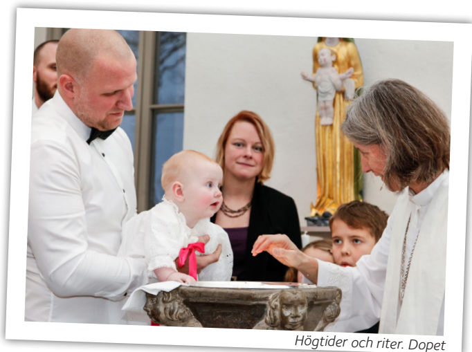
Högtider och riter. Dopet