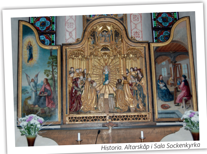
Historia. Altarskåp i Sala Sockenkyrka