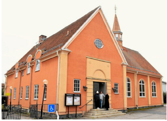
100-åringen Krylbo kyrka firas hela veckan.