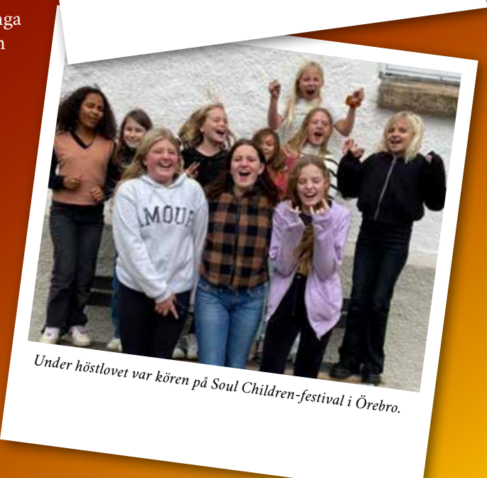
Under höstlovet var kören på Soul Children-festival i Örebro.

TEXT: INGRID ELIASSON