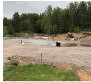
Arbetet med markberedning påbörjades i augusti.