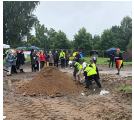
Trots regn var det många som ville vara med när det första spadtaget för det nya församlingshemmet i Boxholm togs den 20 augusti.