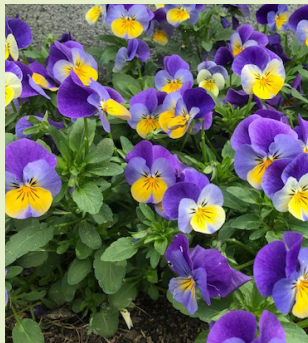
Pensé ( vår )