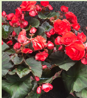
Stor begonia ( sommar )