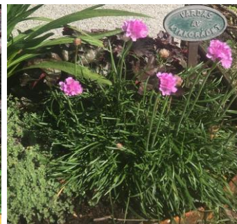
Lammöra, nävor, alunrot och trift är några av perennerna som planteras