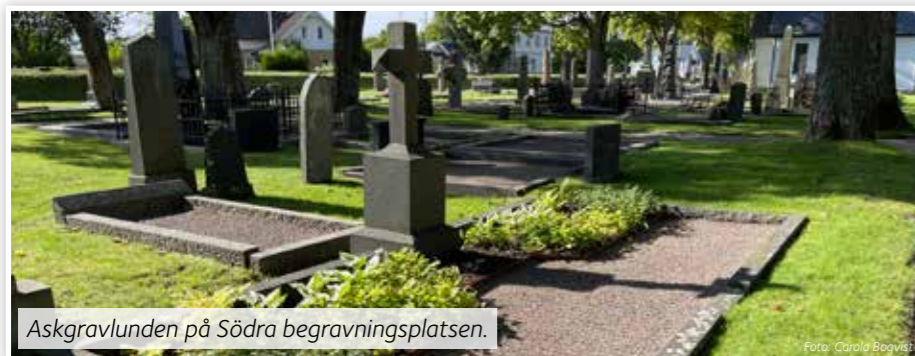
Askgravlunden på Södra begravningsplatsen.

Minneslund finns på två ställen inom Mariestads församling, en på Östra begravningsplatsen och en på Leksbergs kyrkogård. Askgravlund finns också på två ställen, en på Fågelö kyrkogård och en på Södra begravningsplatsen. På Fågelö är den belägen i en grässlätt med närhet till naturen. På Södra begravningsplatsen är det en grusgrav som gjorts om med en plantering, denna plats är under stora fina träd i en mer parkliknande miljö.