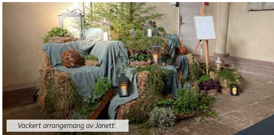
Vackert arrangemang av Janett.