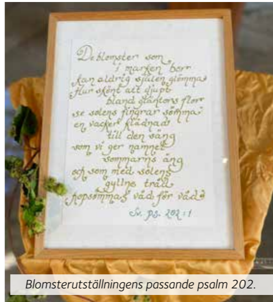
Blomsterutställningens passande psalm 202.