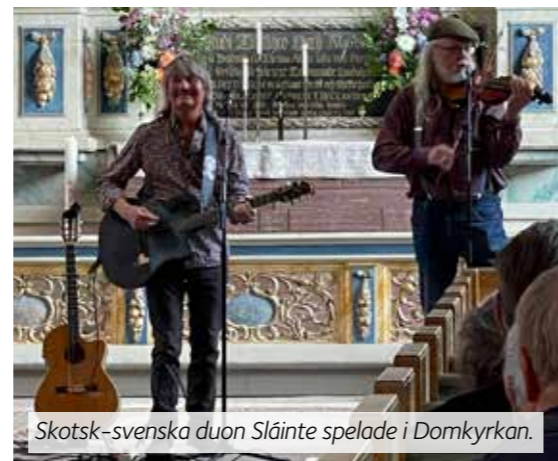
Skotsk-svenska duon Sláinte spelade i Domkyrkan.