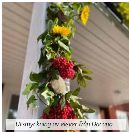
Utsmyckning av elever från Dacapo.