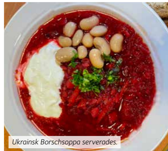
Ukrainsk Borschsoppa serverades.