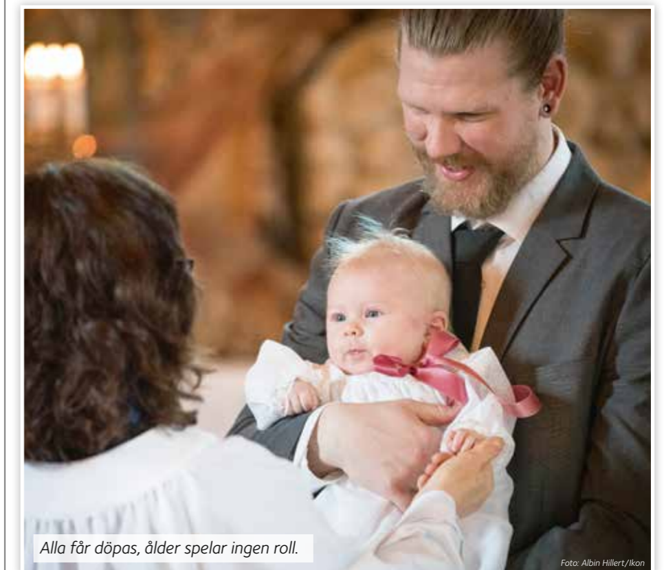
Alla får döpas, ålder spelar ingen roll.

Finns det önskemål om speciella psalmer? Vill ni ha en dopsolist?