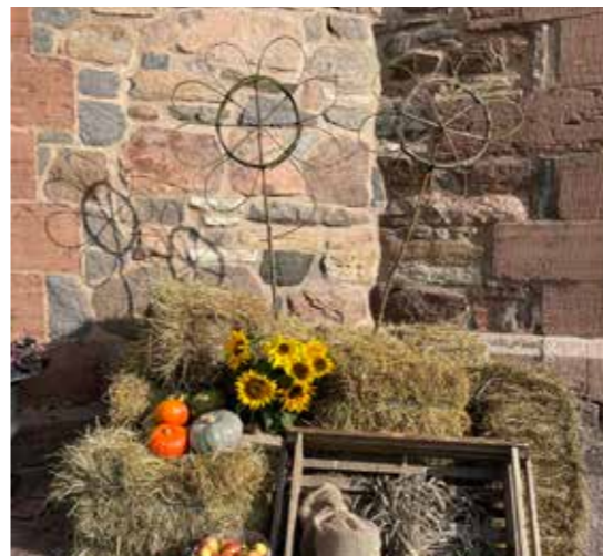
Vackert vid entrén till Mariestads domkyrka.