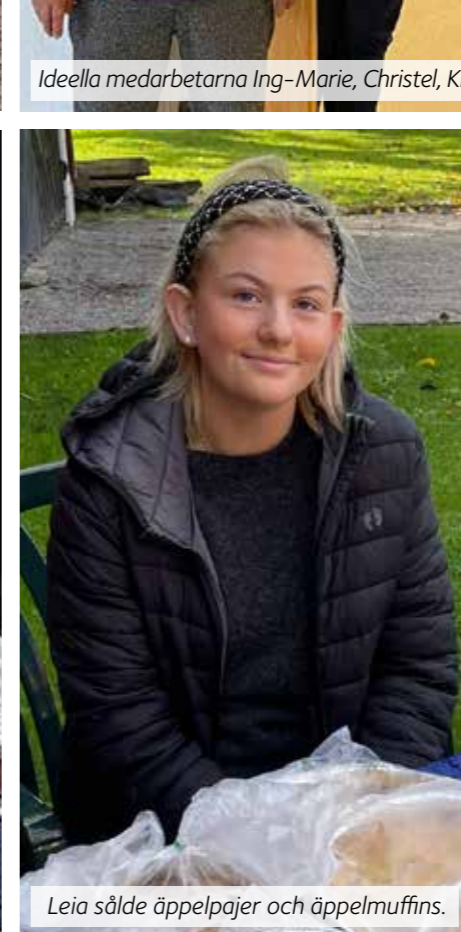
Leia sålde äppelpaj och äppelmuffins.