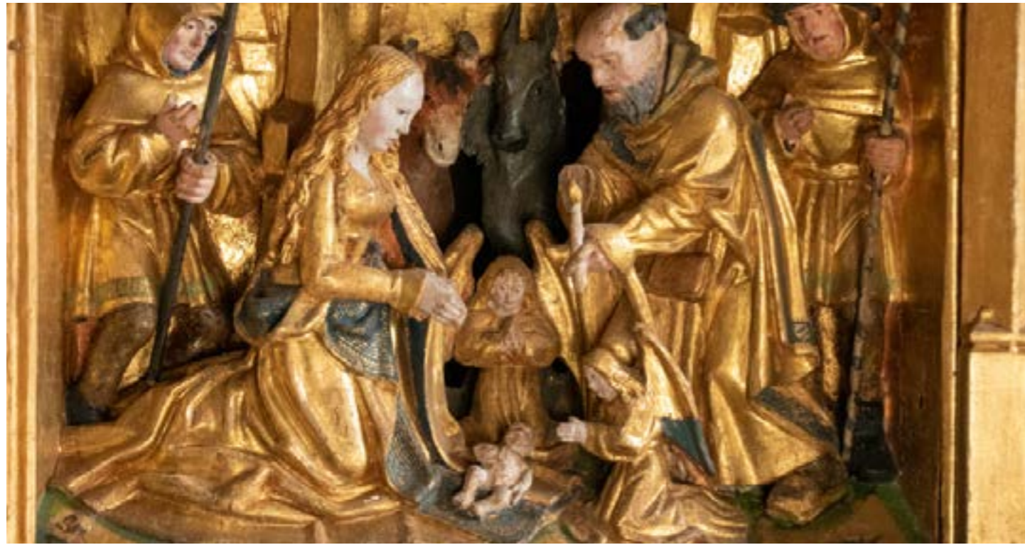
Detalj från altartavlan i Häverö kyrka