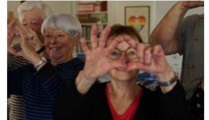
Tillsammans gör vi hjärtan och visar kärlek!

Pratet runt fikaborden fick fart och en lång stund diskuterades begreppen kärlek och älska.