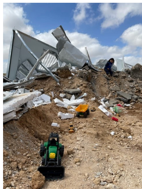
EAPPI kommer fram till ett hus (familj med fem barn) som precis demolerats.

ofta saknar bygglov så finns det inga juridiska hinder att riva dem. Staten Israel är väl medveten om att detta sker.