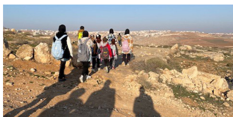
EAPPI följer barn till skolan förbi en israelisk bosättning då det finns risk för trakasserier.

tillhör någon kyrklig organisation. - Det händer att följeslagare blir stoppade vid gränsen och hemskickade igen, berättar Karin.