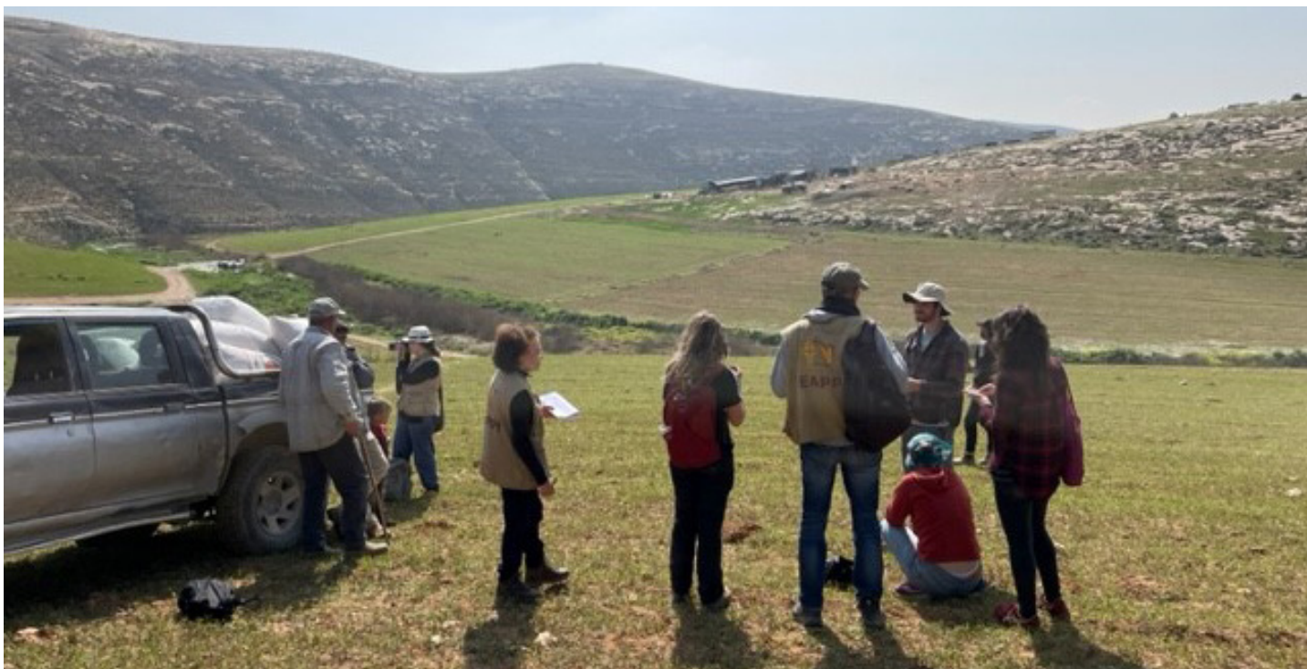
EAPPI plus representanter från olika israeliska fredsorganisationer försöker bringa klarhet i vem som äger marken. Israeliska bosättare har precis lämnat platsen efter att de har trakasserat palestinsk familj och familjens får.

syns tydligt och fungerar som ett skydd, säger Karin. Men det finns inga garantier.