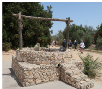
Sykars brunn i bibellandskapet.

Överallt fanns det många och stora kristusbilder. Man skämdes inte för att vara kristen utan var stolt över sin tro.