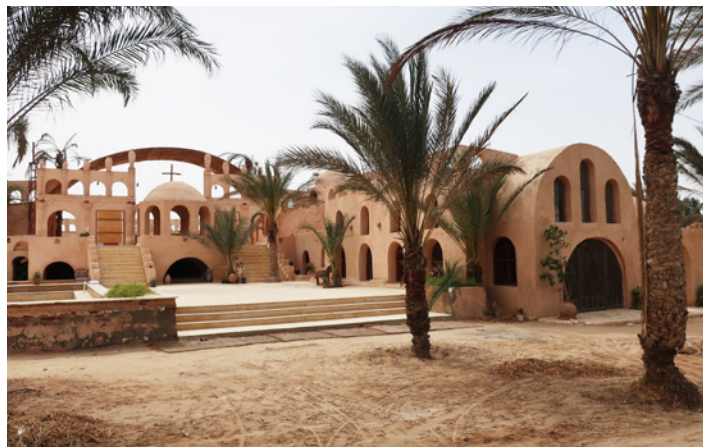
En av de vackra byggnaderna på Anafora.