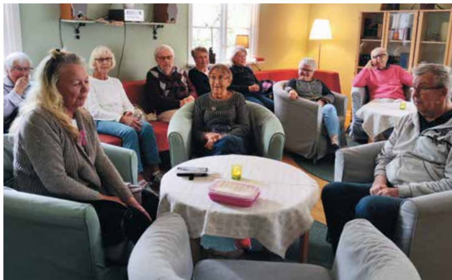
Deltagarna på Torsdagsträffen i Ingaröhemmet tog med varandra på en nostalgisk resa till barndomens jular. Igenkänningen var stor när de pratade om lutfisk, julotta och fernissade golv.