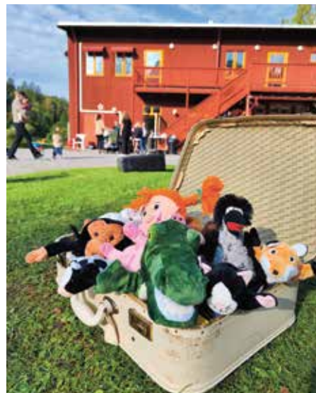
En hel väska full med sångkompisar! Kråksången och Krokodilen i bilen är några av favoriterna.