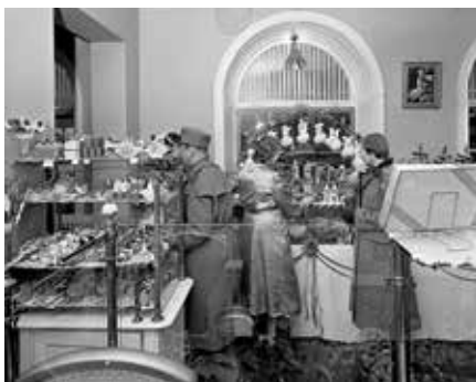
Augusta Janssons karamellfabrik, där Tjongkolan tillverkades och såldes.

ELSA: Min pappa var präst, och på julafton höll han julbön hemma med familjen. Han spelade på flygeln och läste julevangeliet. Och levande ljus var det i granen förstås. På julottan var det så fullt i kyrkan, men jag fick följa med precis bakom pappa och var med på både första och andra julottan, klockan fem och klockan sju. Det kändes så speciellt.