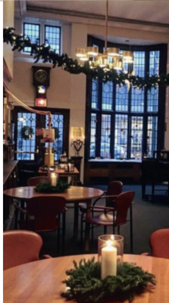
Svenska kyrkan i New York.