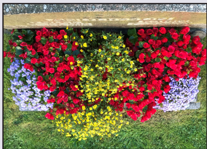
Exempel på sommarblommor