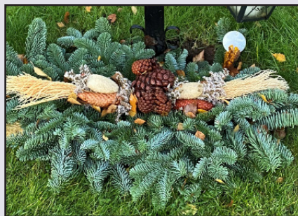
Exempel på gravdekoration