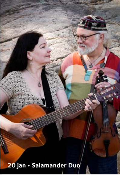
20 jan • Salamander Duo