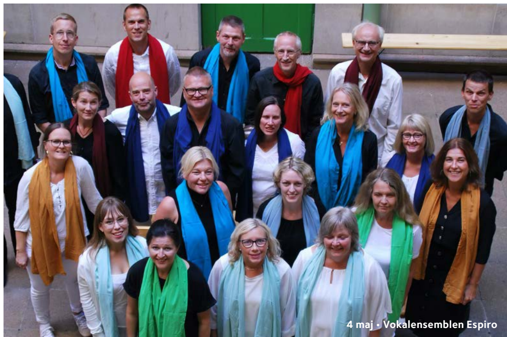
4 maj • Vokalensemblen Espiro