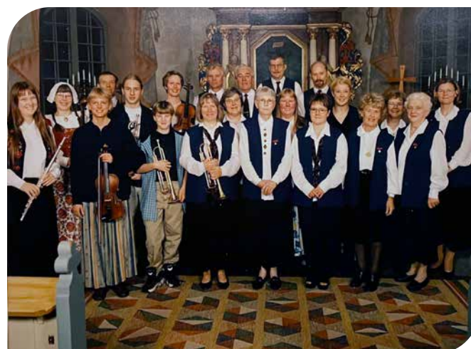
Bilder från tidigare jubileer: 70 år 1993 (ovan) och 75 år 1998 (till vä).