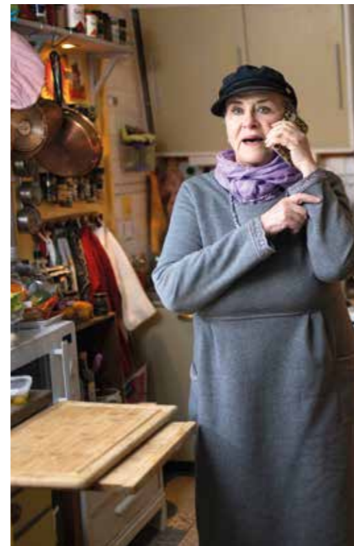
Py samordnar ett nytt arbetsmöte.

– Vi testade olika låtar och jag spelade upp Stad i ljus. Vi skojade lite med den, tyckte att den var så bombastisk. Vi la till och med in applåder från en jättearena. Nu används sången ofta i sto-