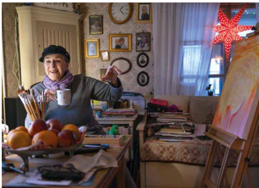
Vardagsrummet är musikstudio, ateljé, kontor, arbetsrum, TV-rum och mycket mer.