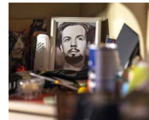
Foto av pappan hon aldrig mött står centralt.