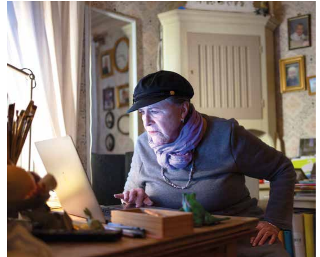
Py arbetar med både musik och konst på datorn.

– Ibland kan det till och med vara så att jag inte står med i listorna över upphovspersoner.