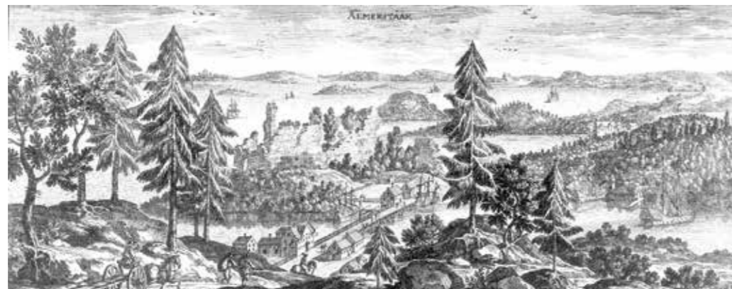
Almare Stäket, 1670-tal.