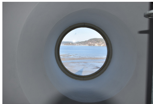
Bakom sidoaltartavlan gömde sig detta vackra fönster