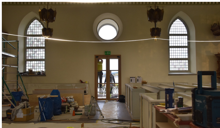
En ny entré har öppnats ut mot Ljungskileviken med en vacker glasdörr