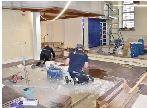
Nytt klinkers läggs i kyrkgolvet