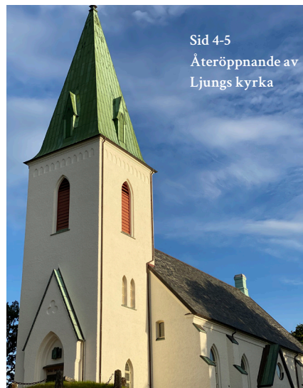
Sid 4-5 Återöppnande av Ljungs kyrka