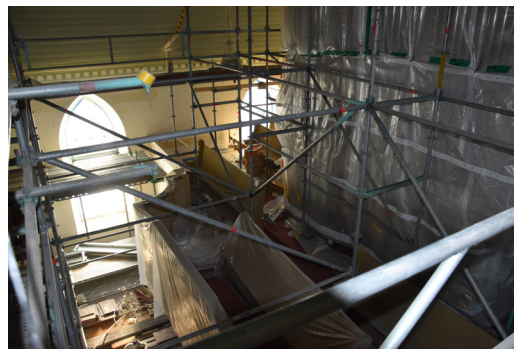
Orgeln inplastad och vi blickar ner mot läktaren högt uppifrån taket