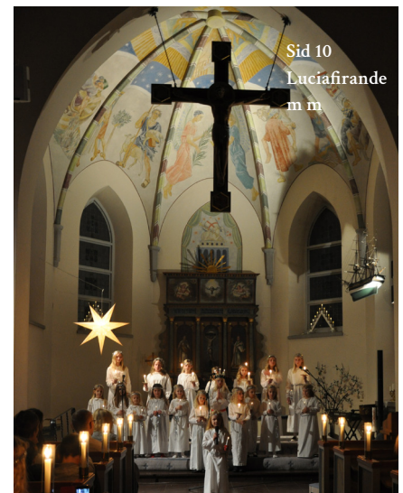
Sid 10 Luciafirande m m