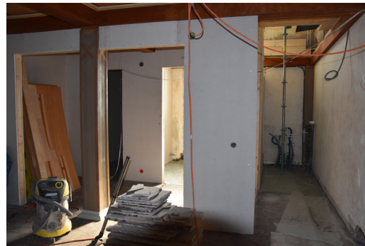
Här byggs nya toaletter och en ny trappa till läktaren.