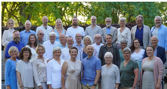
Varberg kammarkör 21/3