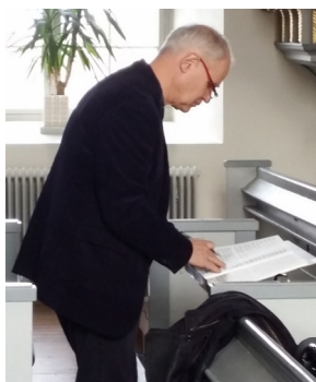
dir. Gunno Palmqvist