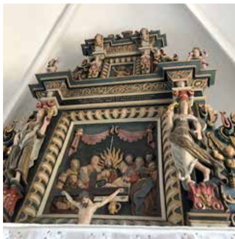
Nattvarden i Stora Herrestad