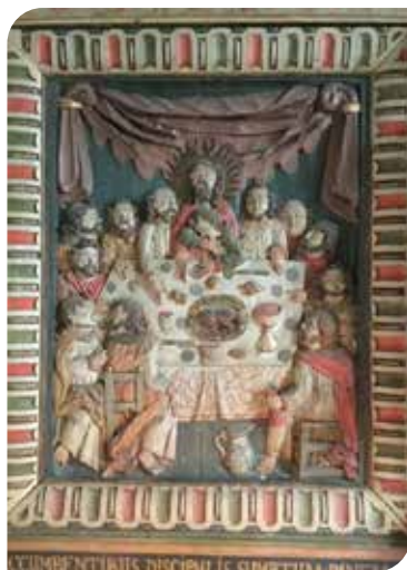
Nattvarden i Borrie.

St Köpinge byväg 72, 271 73 Köpingsbro Besöks- och telefontid: mån och tis 10.00-11.45 Telefon 0411-55 85 00 E-post: st.kopinge.forsamling@svenskakyrkan.se Hemsida: www.svenskakyrkan.se/stkopinge Facebooksida: facebook.com/StoraKopingeForsamling