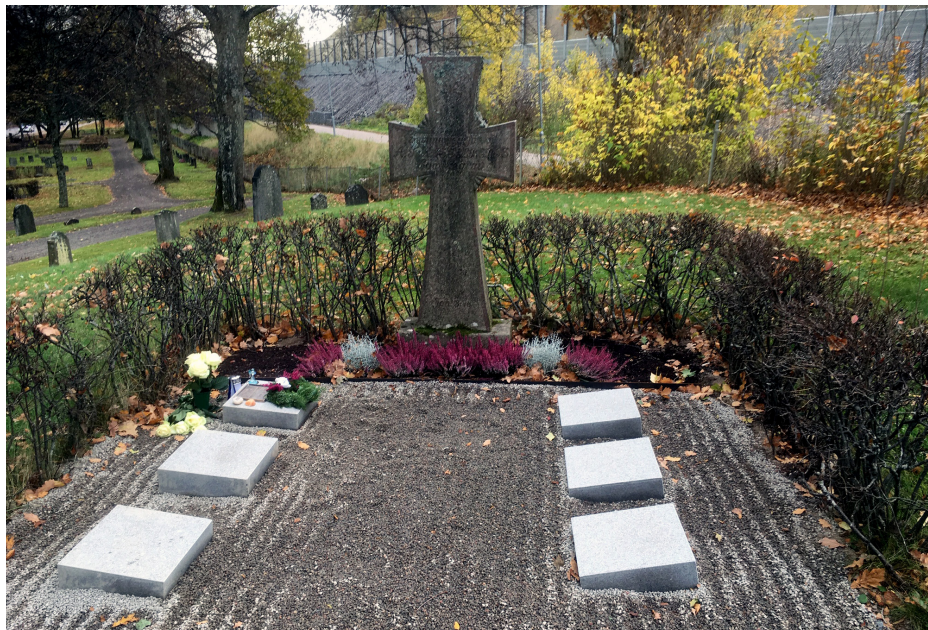
Askgravplatsen Gamla kyrkogården

Askgravplats är ett alternativ för den som vill ha en grav märkt med namn och där gravskötsel ingår i 25 år.