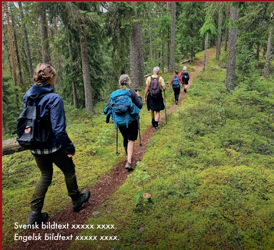
Svensk bildtext xxxxx xxxx. Engelsk bildtext xxxxx xxxxx.