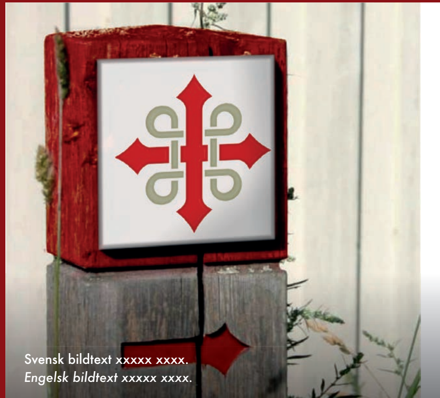
Svensk bildtext xxxxx xxxx. Engelsk bildtext xxxxx xxxxx.