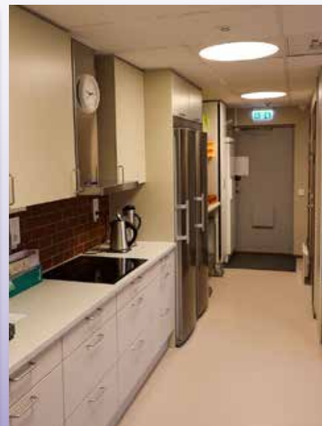
... till supersnyggt!