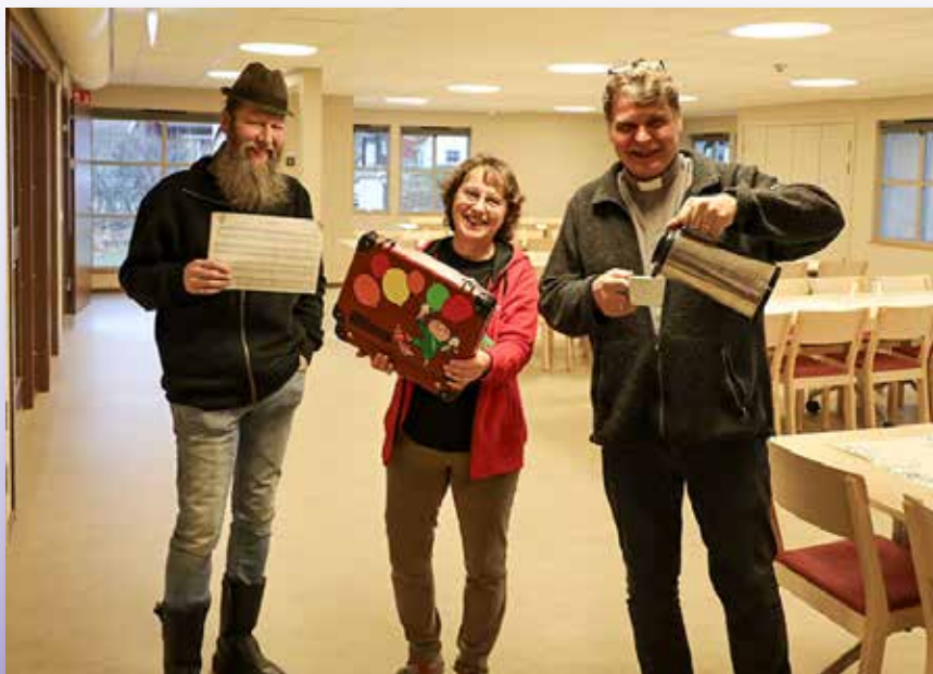
Äntligen kan vi köra igång igen, vi ses!