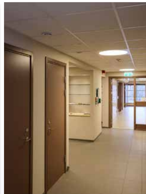
... till fullt fantastiskt!