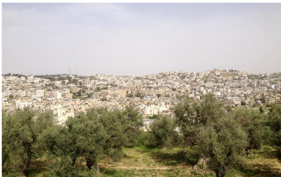
Bild över gamla staden i Hebron med den plats där Abraham och Sara enligt tradition är begravda.