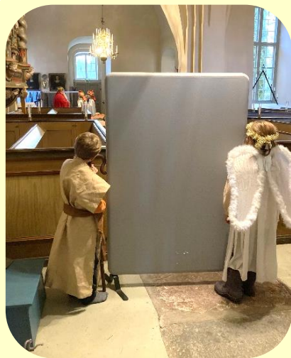
Bild från fritidshemmets julspel för förskolans barn i Runtuna kyrka -23