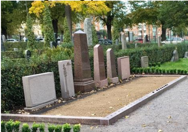
Anlagd 2020 2:a gravsättningen tillsammans med första.