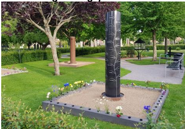
Anlagd år 2011 2:a gravsättningen tillsammans med första.