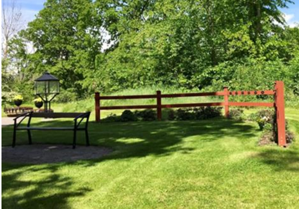
Anlagd år 2017 2:a gravsättningen sker inom samma område.