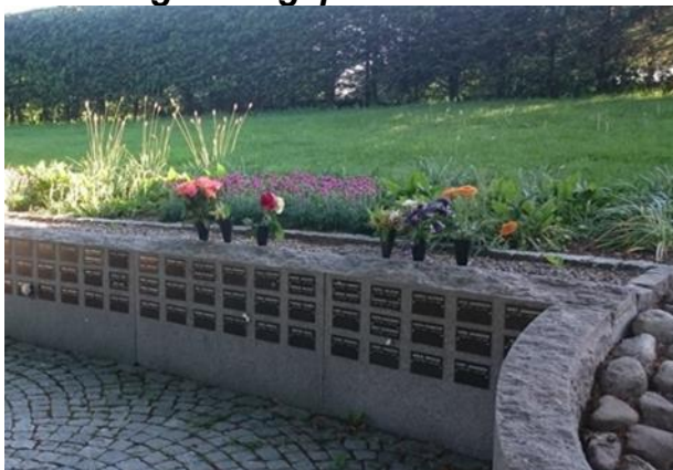
Anlagd år 2003 2:a gravsättningen sker inom samma område.