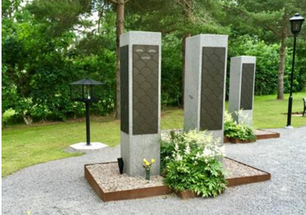
Anlagd år 2018 2:a gravsättningen sker inom samma område.