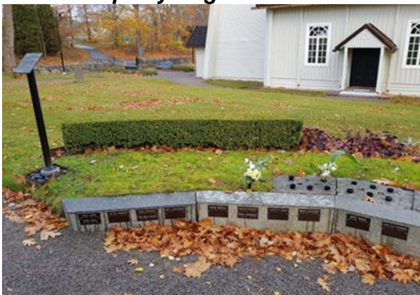
Anlagd år 2006 2:a gravsättningen sker inom samma område.