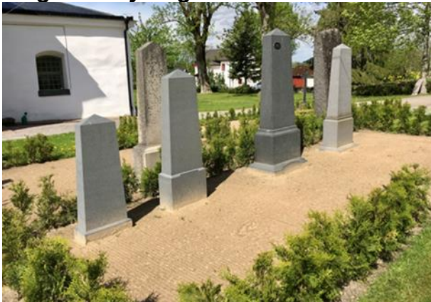
Anlagd år 2018 2:a gravsättningen tillsammans med första.