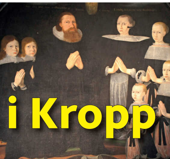
Den unika läktarpredikstolen, 1600-talsmålningen av prästfamiljen Hoffgaard och det gamla krucifixet pryder Kropps kyrka.