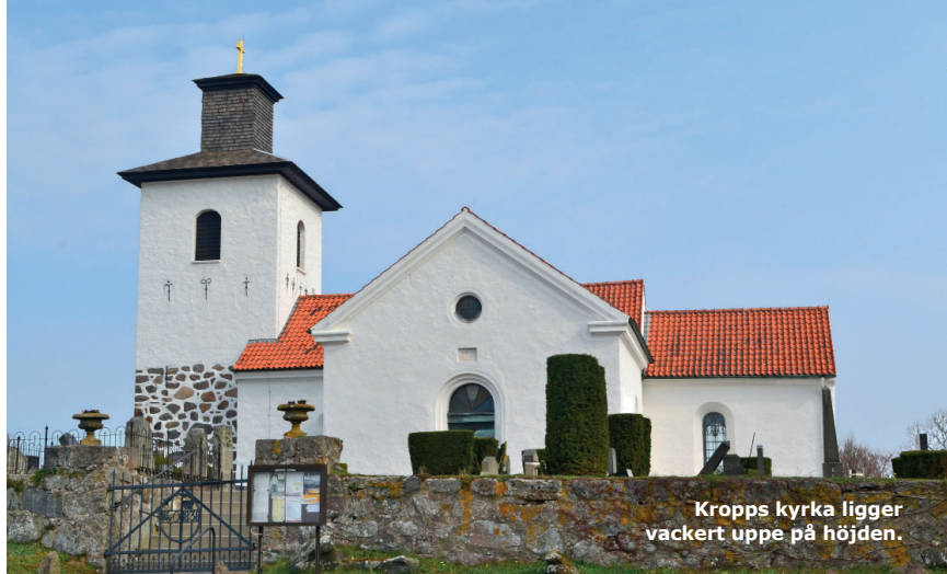
Kropps kyrka ligger vackert uppe på höjden.