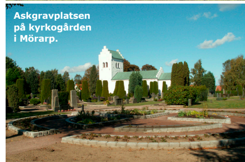
Askgravplatsen på kyrkogården i Mörap.