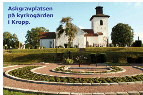
Askgravplatsen på kyrkogården i Kropp.

Gravrättsinnehavaren står själv för gravering av stenen samt transporter av gravsten. Ansökan om textutförande skall lämnas till församlingen för godkännande innan gravering. Blommor efter begravningstjänst får inte läggas på askgravplatsen.