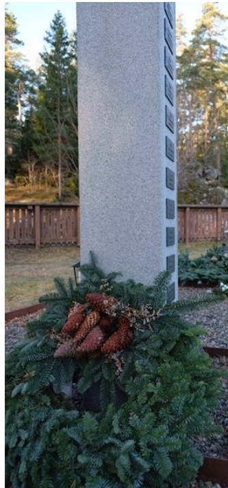
Inför Alla Helgons dag smyckar kyrkogårdsförvaltningen med krans och granris.

Kyrkogårdsförvaltningen ansvarar för all skötsel och övrig smyckning i askgravlund.