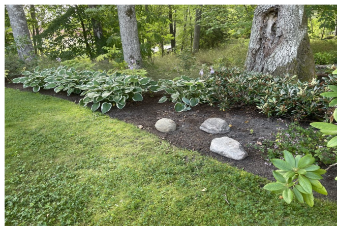
Bild från den fullbelagda askgravplatsen "skogsrabatten" på Trosa begravningsplats, med natursten och graverad namnskylt finns på Vagnhärad och Västerlångs kyrkogårdar.

Kostnad: Vagnhärad, Västerlång och Trosa begravningsplats askgravplats med natursten och graverad namnskylt 7 000 kr. Trosa Begravningsplats askgravplats med polerad och graverad granithäll 12 000 kr.