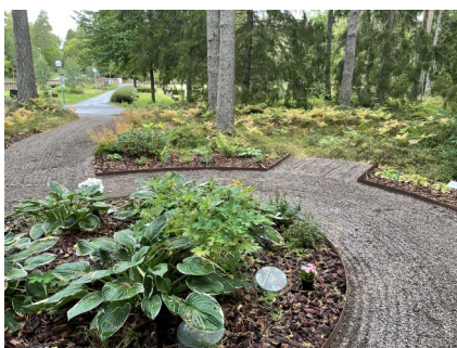
Askgravplats Trosa begravningsplats, "Skogsläntan".