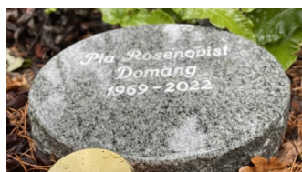
Askgravplats på Trosa begravningsplats. Här används blankpolerade granithällar för ingravering av namn.