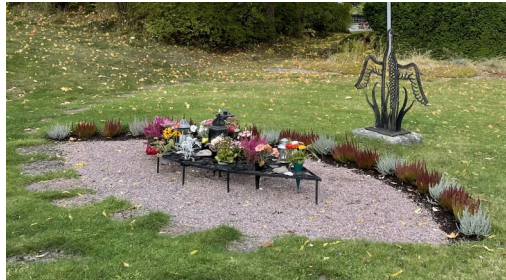
Trosa stads kyrkogård