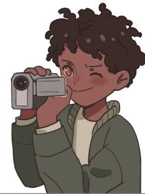
Illustration: Dorothea Malmros

Obs! Skaparcafé för alla åldrar i Hamnkyrkan!