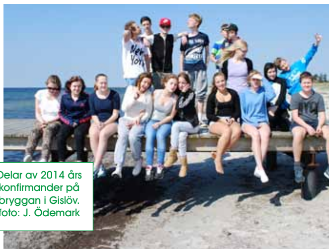
Delar av 2014 års konfirmander på bryggan i Gislöv.