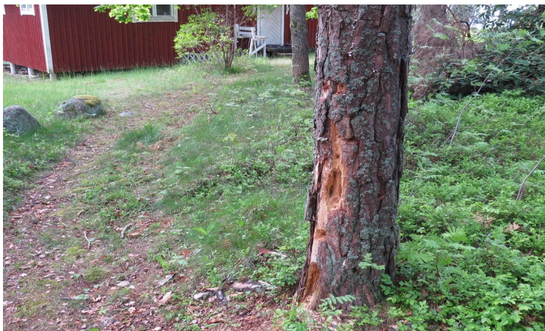
Tallen på bilden kan betraktas som ett uppenbart riskträd