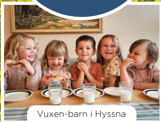
Vuxen-barn i Hyssna

"Dina ögon är fyllda av glädje. Säg, vad har de sett för att få sånt ljus? De har sett hur vårt liv fick en mening. Jesus fyller mörkret med liv och ljus."